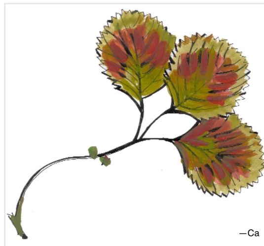
Calcium deficiency / Déficience en calcium